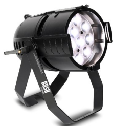
LED Martin Rush

8 x Forma Fresnel 650W (dimm-/schaltbar in maximal 3 Gruppen; nur weisses Licht)